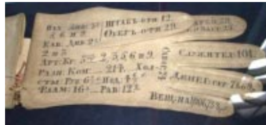
Перчатки дежурного генерала. Россия, XIX в.

Экспозиция выставки «Гусар – питомец славы», Государственный музей «Царское Село», г. Пушкин, Санкт-Петербург